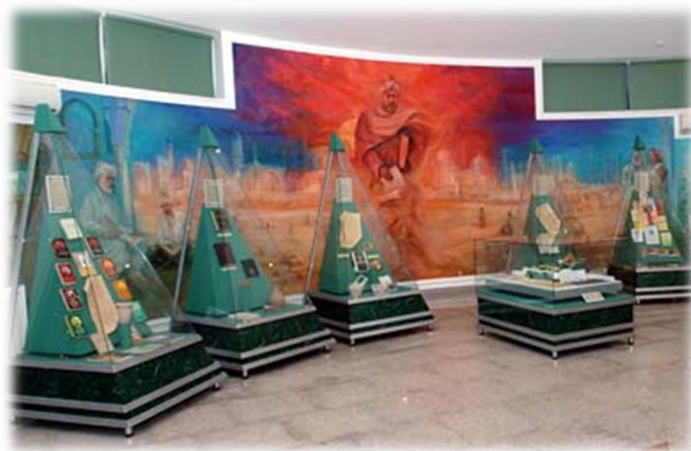
Musée de l'Université nationale kazakhe Al Farabi

Cet intérêt pour la recherche fondamentale dans le domaine de l'alfarabisme dans le monde confirme que la philosophie arabe médiévale était la première héritière de la philosophie grecque antique qu'elle a développé et enrichi par ses nouvelles interprétations. En ce sens, la philosophie d'Al Farabi est devenue un « pont » entre les cultures de l'Orient et de l'Europe.